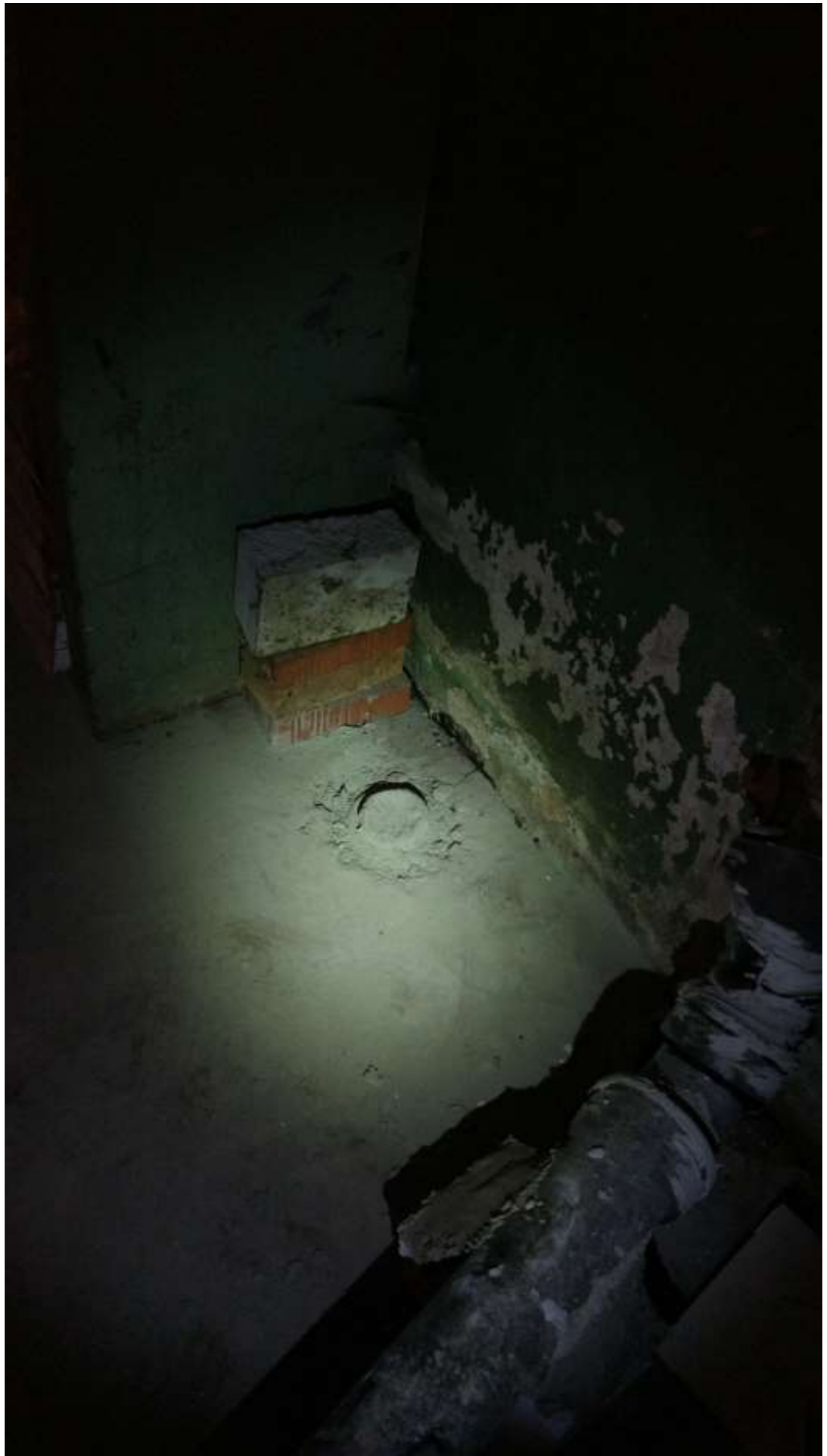
Рисунок 1 Не демонтирован старый лежак